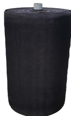
Rete antigrandine professionale in HDPE UV stabilized