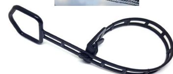
NET-FIX chiudirete per il periodo invernale