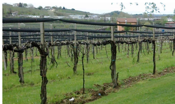
Rete chiusa nel periodo invernale